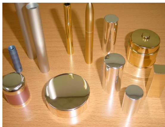
ピカ 1 による光沢処理製品